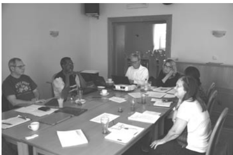
Komise UF při práci

To na Aljašce je situace zřejmá. Synodem z UF vyloučená skupina pokračuje ve své práci, prohlašuje se za Moravians, i když byla opakovaně důrazně požádána, aby to nedělala, a dokonce navazuje kontakty s odpadlými skupinami z jiných provincií (Honduras, Keňa, Tanzánie). Ukazuje se, že značka „Moravian“ se stala v posledních desetiletích velmi přitažlivou, ale řád a disciplína v UF nikoli.