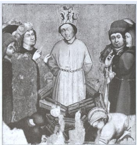
Jan Hus na hranici - kostel v Roudníkách před rokem 1486

Jan Hus se již z tohoto úspěchu svých stoupenců těšit nemohl. V paměti husitů však žil dál. Vedle laického kalicha patřilo uctívání svatého Jana Husa k hlavním poznávacím znakům utrakvistické církve. Krátce po Husově a Jeronymově popravě pronesl Jakoubek v Betlémské kapli kázání „na paměť nových mučedníků“. V deskovém malířství druhé poloviny 15. století byl Jan Hus zobrazován jako mučedník a patron české (kališnické) církve. Oltářní křídla ze severočeské vesnice Roudníky z doby před rokem 1486 (dnes v Husitském muzeu v Táboře) znázorňují kromě Husa na hranici také mučedníky Jakuba, Šebestiána a Vavřince... Po své mučednické smrti sloužil Hus svým stoupencům jako identifikační figura překračující svým významem hranice mezi jednotlivými proudy. Jeho díla se dále opisovala a od počátku 16. století také tiskla. Nicméně mnohem více než jako autor přežíval Jan Hus v utrakvistické církvi jako symbol.