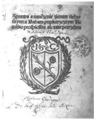
tiskařská značka Mikuláše Klaudiána

V loňském roce uplynulo 500 let od chvíle, kdy v Norimberku vyšla tiskem první mapa Čech (1518), takzvaná Klaudiánova mapa. Mikuláš Klaudián byl boleslavský lékař, který se připojil k Jednotě bratrské a stal se prvním boleslavským tiskařem. Od roku 1511 byl v Norimberku, ve známé tiskařské dílně, ve které vyšla posléze i mapa Čech. Nedlouho potom, ještě v roce 1518, přišel Klaudián zpátky do Boleslavi a zřídil si tu tiskařskou dílnu na Karmeli, v budově, která je dodnes dochovaná a visí na ní pamětní deska. Klaudián však nepůsobil příliš dlouho, 1521 těžce onemocněl a zemřel.