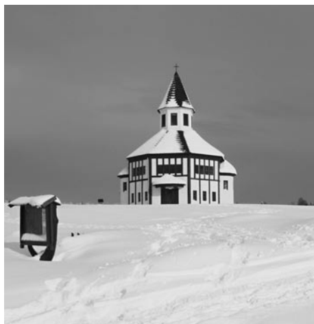
...a takto vypadal kořenovský kostelík v zimních měsících, když ještě bývaly zimy