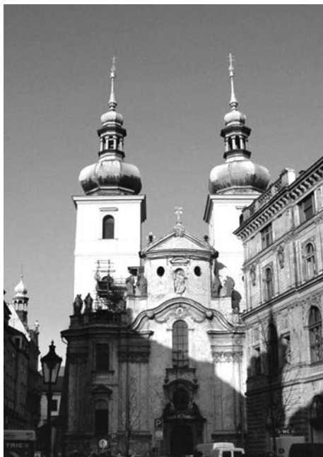
dnešní podoba kostela sv. Havla, kde Waldhauser kázal

Pravda je, že Konrád si nejen nebral servítky, když líčil neřesti mnichů, ale vystoupil proti nim i úředně – arcibiskupa Arnošta z Pardubic žádal, aby zakročil proti zlořádům, které v klášteřích panovaly, ten mu však sdělil, že kláštery mají vlastní organizaci a nepatří do jeho pravomocí. Podobně psal Waldhauser i pasovskému