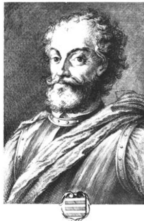
Nejznámější portrét pana Václava Budovce z Budova

O panu Harantovi se v pramenech víckrát mluví jako o evangelíku, měl prý konvertovat k evangelictví někdy během stavovského povstání, dostatečně spolehlivě to však doloženo není. U měšťanů spojených s Jednotou bratrskou pak není zřej-