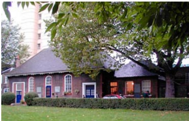
Dnešní sídlo sboru Fetter Lane v Chelsea

Kompenzace za škody utrpěné válkou a zvláště peníze, které církev získala prodejem lukrativních pozemků ve Fetter Lane společnosti Goldsmith Company, posloužily jednak k rekonstrukci a opravám v novém sídle sboru, jednak k opravě a zařízení nového ústředí a knihovny v Muswell Hill 5-7 a ještě zbylo pro stavbu kostela Jednoty v Bathu.