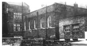
staré budovy sboru ve Fetter Lane

V noci ze soboty na neděli, 11. května 1941, svrhla Luftwaffe na oblast množství zápalných bomb. Veškeré historické objekty byly naprosto zničeny, jako zázrakem nebyly oběti na životech. To znamenalo konec Fetter Lane jako budov, ne sboru.