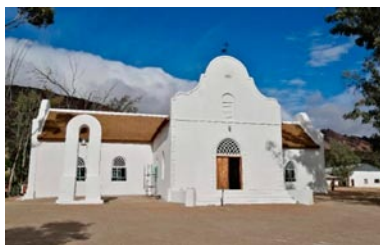
Nově zrekonstruovaný kostel ve Wupperthalu (o požáru jsme informovali 2019)

Bratr biskup Temmers podlehl následkům nemoci 7. června letošního roku a rozloučení s ním je v tuto chvíli možno shlédnout na Facebooku, stačí, když si zadáte celé jméno bratra biskupa v internetu a záznam vám vyskočí.