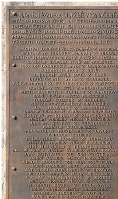
Deska se jmény popravených umístěná na staroměstské radnici

mé, kdo z nich byl opravdu členem Jednoty a kdo patřil mezi sympatizanty, mající s Jednotou kontakt, podporující ji, ale formálně do ní nepatřící. Jak uvádí Historie o těžkých protivenstvích , měla být téměř polovina odsouzených spojena s Jednotou.