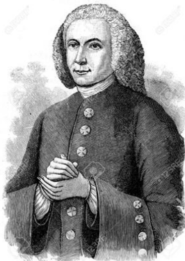
biskup John Gambold na soudobé rytině

Četba Luthera nejprve a potom i setkání s bratřími v něm posilovalo přesvědčení, že ospravedlnění pouhou vírou je dobře biblické učení a že metodistický důraz na posvěcený život a zbožné úsilí člověka k tomu nic nepřidá. Sám trpěl dlouhodobě úzkostmi, že přes všechnu askezi a cvičení v pobožnosti zůstává hříšným člověkem a tělesné žádosti se mu nepodařilo umrtvit.