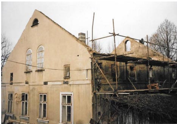
Zcela „odstrojený“ sbor před rekonstrukcí na podzim roku 2000

Pro další historii domu je důležitý rok 1863. Tehdy vypukl požár, který „těž strávil stavení č.p. 80 tak nazvaný Zbor a při něm se nacházející