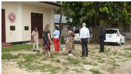
členové komise před sborem Jednoty na Zanzibaru

O koloniální minulosti již padlo slovo ve spojení s misijní konferencí, komise si ji připomněla ve volném dni, kdy navštívila sbor a školu na Zanzibaru, a zastavila se i v památníku obchodu s otroky. Zanzibar byl majetkem ománského sultána a až do