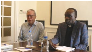
tajemník Unity Boardu, bratr Boytler, s předsedou Tanzánské východní provincie

Komise shledala, že v řádu je dostatečně jasně zakotveno, jak by se vztahy měly utvářet a jaké jsou pravomoci biskupů a vedení provincií, uvádět to do života je záležitostí praktickou a pastorační. Pro jasnější vymezení očekávaných postojů těch, kdo mají v UF rozhodovací pravomoci, navrhla komise stručná pravidla, navazující na Řád UF. Bude záležet na Unity Boardu, zda je shledá užitečnými a bude je chtít využít.