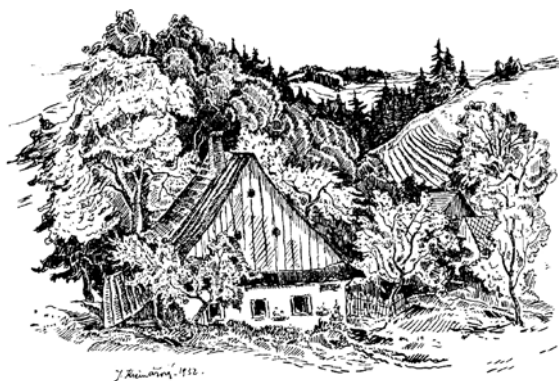
pohled na Kunvald (1932)