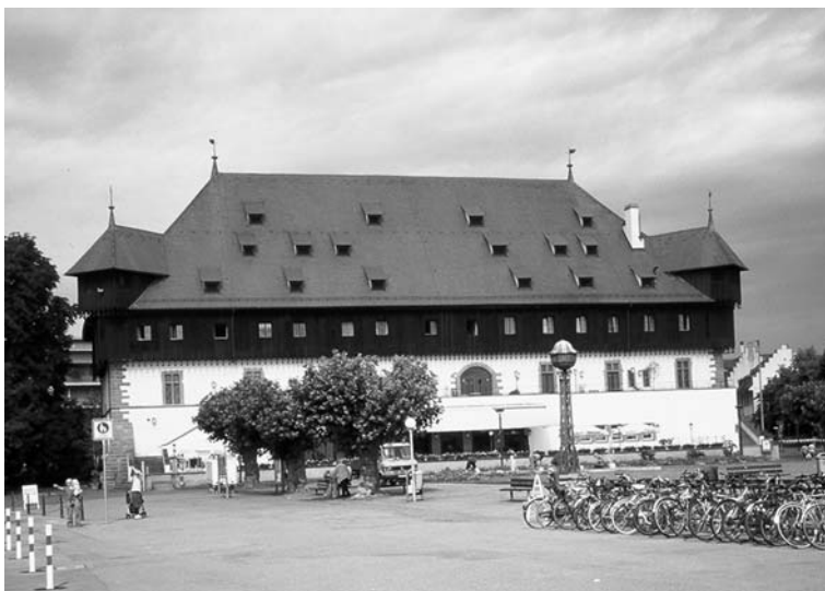
Budova, v níž se roku 1415 konal Kostnický koncil a kde byl souzen M. J. Hus