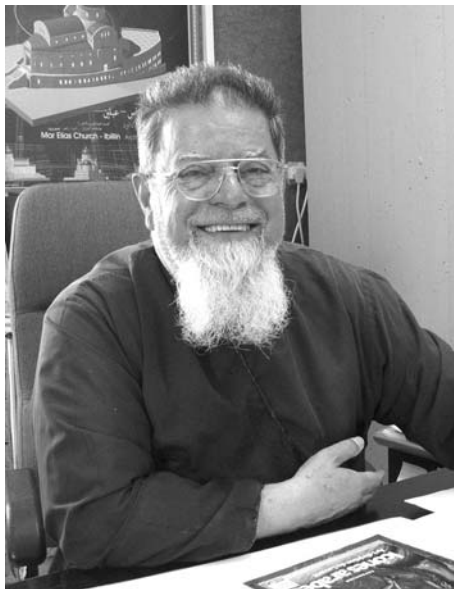
biskup Elias Chacour

Budovat mír na studentských lavicích - to je způsob, jak tyto školy definují svůj úkol. Studenti tří různých věr tu žijí, učí se a pracují spo-