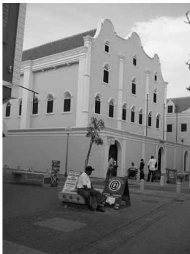
Synagoga ze 17. století na ostrově Curacao

První kázání jsem měl na první adventní neděli ve sboru Maranatha ve Willemstadu. Sbor tvoří surinamci, jejichž rodiče sem přišli za prací v době války. Koncern Shell tu měl jednu z největších rafinerií ropy, odkud pocházelo až 80 procent leteckého benzínu pro americkou armádu. Dnes je rafinerie pronajata venezuelské státní společnosti a v turistických průvodcích se nedočtete, že příležitostně otravuje vzduch.