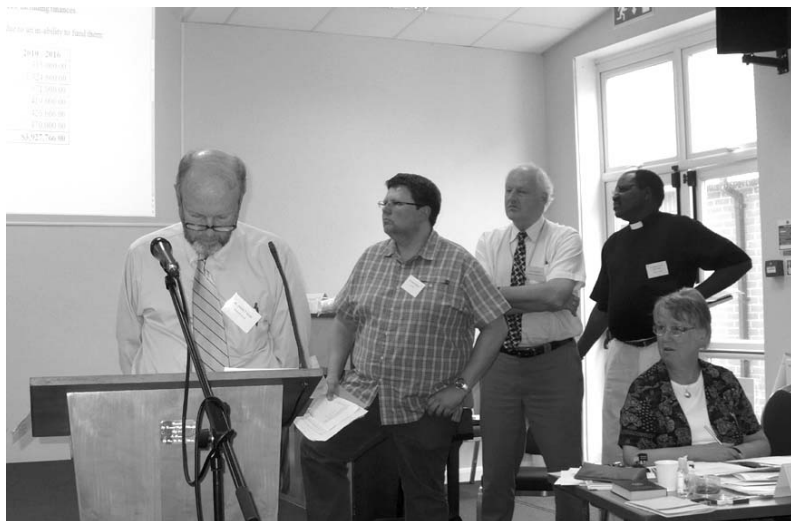
Zpráva a návrhy finanční komise.

Členství na synodu bylo přiznáno i zástupcům biskupů Jednoty, budou mít dva delegáty bez hlasovacího práva. A jak je zmíněno v úvodu, hlasovací právo dostal předseda Unity Boardu.