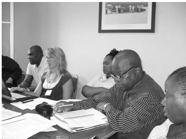
Práce v komisi

Druhým velkým celkem jsou zprávy ze všech provincií a součástí Jednoty, které jsou projednány v plénu synodu a z nich plynoucí otázky k řešení přiděleny komisím. Třetí část práce tvoří projednání návrhů podaných synodu a rozhodnutí o nich.