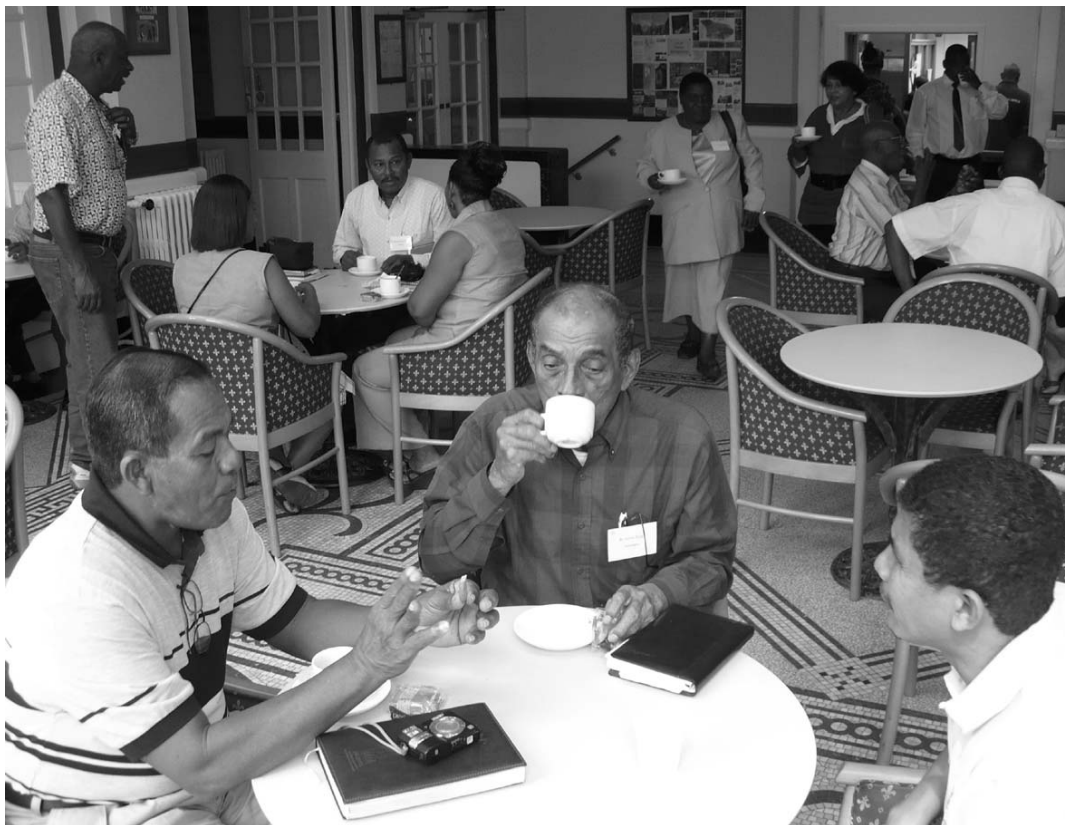
káva v přestávce jednání delegáti ze střední Ameriky

Tak radikální změnu ale nelze provést najednou. Synod uložil Unity Boardu zkoumat, jak změnit strukturu UB a vedení UF směrem k větší kontinuitě a předložit návrh příštímu synodu. Zároveň bylo vytvořeno místo administrativního tajemníka UF (Unity Business Administrator), pracovnice či pracovníka, který by měl nahradit dosavadní sekretářku předsedy UB a mít mnohem větší pravomoci a povinnosti. Fungování ústředí UF by se mělo výrazně zlepšit.