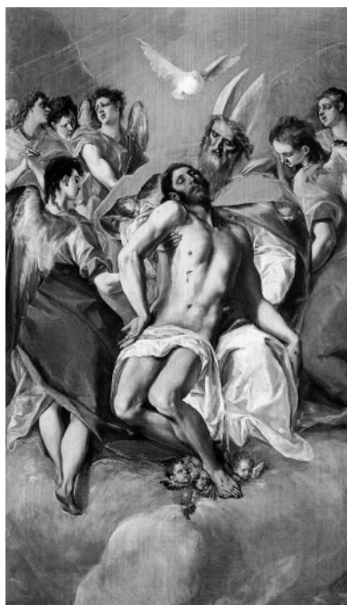
Svatá Trojice - El Greco