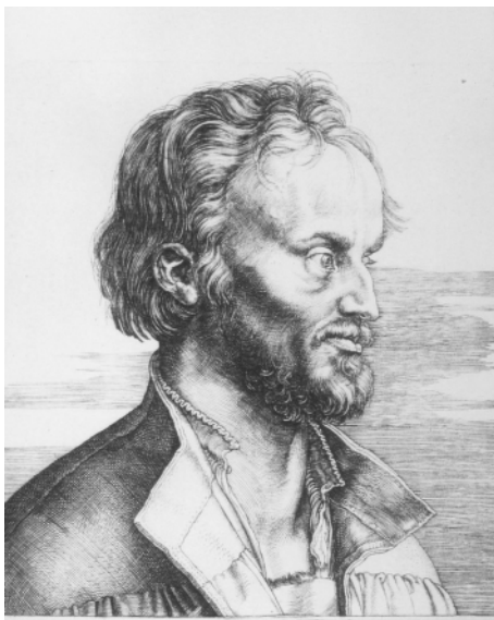
Melanchthonův portrét od Albrechta Dürera