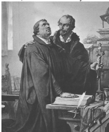
Melanchthon a Luther

Melanchthonovi šlo o to, aby učení evangelia bylo neseno vzdělanými lidmi, na nejvyšší úrovni doby, to byla pro něj největší zbraň v zápase o reformaci. Měl kontakty s učenci prakticky po celé Evropě, neuvěřitelně rozsáhlou korespondenci s vědci, teology,