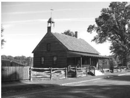
Sbor St. Phillips, rekonstruovaný dřevěný kostelík černošského sboru Jednoty

a většina záležitostí se spravuje v každém distriktu odděleně. Jak plyne z počtů, ordinovaný kazatel je v každém druhém sboru a je potřeba služby řady neordinovaných pracovníků. V roce 2005 byla ordinována první kazatelka této provincie a v roce 2008 byl zvolen nový biskup.