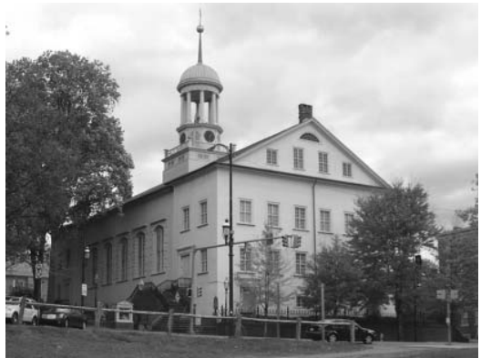
Historická budova Central Church v Bethlehemu, postavená v 19. století