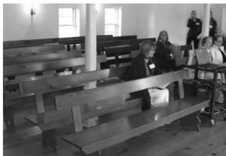
bývalá modlitebna v historickém sborovém domě

Samotná konference se konala v prostorách Moravian College, převážně v historickém centru, v koleji pro hudbu a umění a v historickém sborovém domě, kde bývala v 18. století první modlitebna a kde je dnes muzeum. Pouze úvodní přednáška byla v budově teologického semináře.