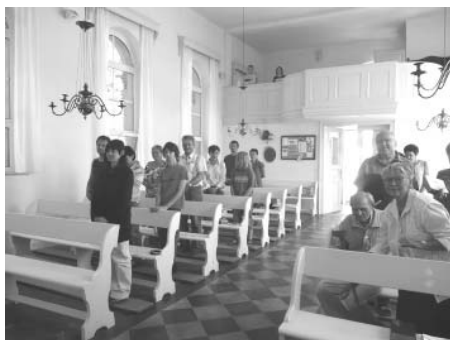
...a potštejnský kostelík.