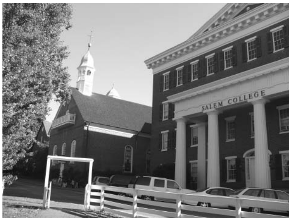
náměstí ve Winston Salemu s budovou Akademie pro dívky a sborem Home Church

Jižní americká provincie tedy vznikla až na druhý pokus. Lord Granville tu nabídl v polovině 18. století Bratřím ke koupi 100 tisíc akrů (zhruba 400 čtverečních kilometrů)