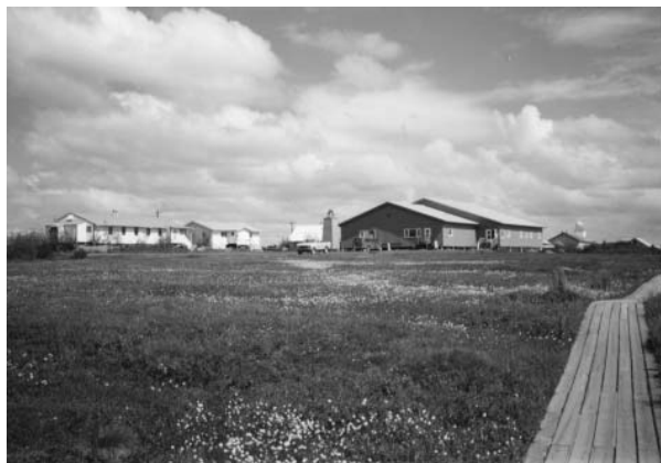
Velice prosté ústředí Jednoty bratrské v Bethel na Aljašce, budova vpravo je zároveň kostel

Provincie Aljaška má dnes 23 sborů a 13 ordinovaných kazatelů. Členů je necelých 1700, ale jsou roztroušeni na ohromné ploše, rovnající se zhruba celé západní Evropě. Zvláště v zimě pak jsou vzájemně naprosto odříznuti. Proto je rozdělena do pěti distriktů,