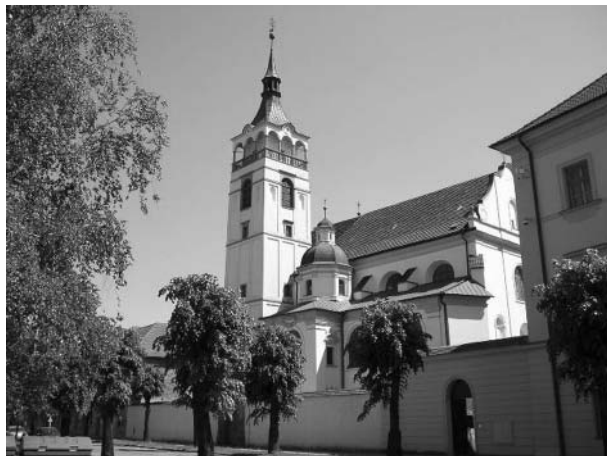
Bývalý bratrský sbor v Lipníku nad Bečvou, dnes kostel sv. Františka Serafinského.

Petr Vok svou příslušnost k Jednotě bratrské, k velké nechuti svého bratra Viléma, který se stal aktivním podporovatelem katolické reformy a jezuitského řádu, kterému