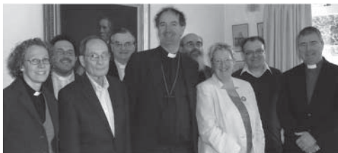
společná komise britské Jednoty a Church of Ireland