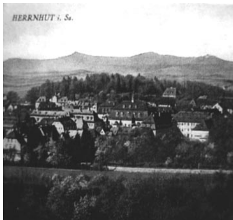
Pohled na Ochránov (Herrnhut) v Horní Lužici

Po Bílé hoře odchází z našeho území především nekatolicky smýšlející šlechta a měšťané. Prostý lid začíná odcházet do exilu v důsledku tíživého poddanství až v nově nastolených podmínkách ve dvacátých letech 18. století. Za vlády císaře Karla VI. (1711–1740) totiž dochází v českých zemích k opětovnému zesílení rekatolizace. Náboženské hnutí bylo v této souvislosti neseno nejprostšími, sociálně nejnižší postavenými obyvateli našich zemí. Tito noví exulanti odchází především do oblasti dnešního Slovenska, Slezska a do Saska.