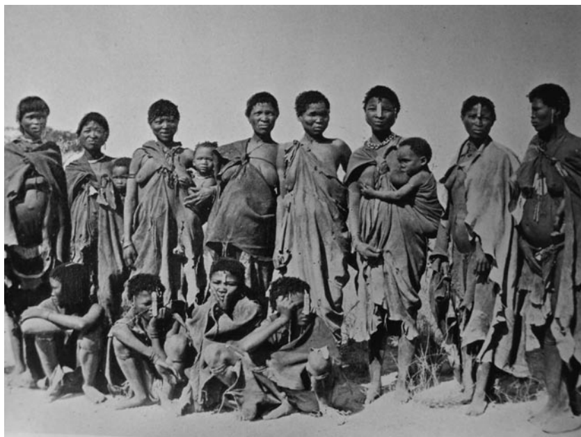
Skupina žen a dětí z kmene Khoikhoi

Misijní stanici Groenekloof (*1808, od 1854 Mamre) by měla být v příštích několika číslech NBL věnována zvláštní pozornost. Budeme sledovat spolu se vznikem stanice i životní osudy zmiňovaných bratrů Bonatzů a Küstera. Stěžejním pramenem pro pochopení souvislostí je deník z průzkumné cesty obou misionářů, který se dochoval v Centrálním archivu Moravské církve v Ochranově (Unitätsarchiv der Brüdergemeine, Herrnhut). Je zdrojem informací o jejich putování z misijní stanice Gnadenhal do Kapského města a dále do Groenekloofu. Deník by nám měl přiblížit nejen to, jakým způsobem byly šířeny myšlenky obnovené Jednoty bratrské u místního domorodého kmene Khoikhoi, ale je také dokladem nezbytné komunikace členů Ochranovské církve s místními správními úřady a vedením bratrského sboru.