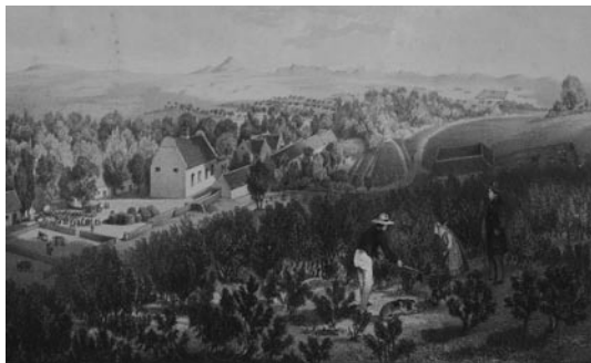
pohled na misijní stanici Groenekloof