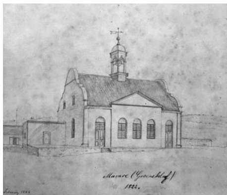
kostel v Groenekloofu