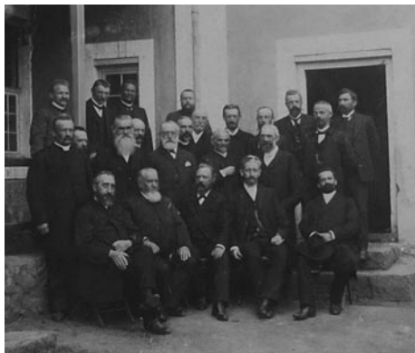
Skupina misionářů obnovené Jednoty působících kolem roku 1905 ve Východním Kapsku

ní navazují bratrské životopisy na tradici katolické hagiografie, i když oproti katolickým životopisům obsahují bratrské životopisy i vyličení negativních vlastností daného jedince. Vznikaly tak spíše příběhy o životě zemřelých spolubratrů, které měly být psány značně populárně. Životopisy tedy vznikaly s tím úmyslem, aby byly čtivé a uspěly nejen u dospělých členů, ale i u dětí, které s nimi měly být od útlého dětství seznamovány a měly se tak poučit z příběhů jiných.