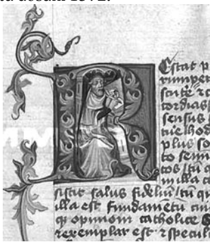
Vyobrazení Viklefa v pozdějším rukopise

Oxfordská studia připravovala Viklefa (tak jako mnohé jiné) jak pro církevní službu, tak pro úřednickou kariéru. Již během působení na univerzitě byl podporován výnosy dokonce ze dvou obročí, kde ovšem podle tehdejšího zvyku ani moc nepůsobil... To tedy nebyl zrovna vzorový start pro reformátora církve a jejího kritika! – ale tak to tehdy chodilo. Svým způsobem bylo církevní vzdělávání v té době jediným způsobem, jak mohl někdo neurozený překonat středověké rozdíly, vyplývající z rodové příslušnosti k určitým stavům. Viklefových diplomatických služeb využíval král Edward III., který se mu odvděčil udělením fary v Lutterworthu.