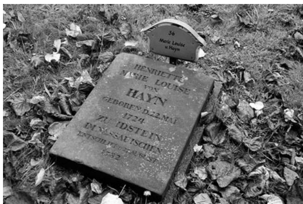
hrob Luisy von Hayn na ochranovském hřbitově