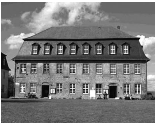
budova „panského domu“ v Herrnhagu dnešní stav