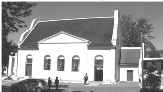
Historický kostel v Mamre, který sboru zdaleka nestačí. Nedělní shromáždění se konají na dvou dalších místech.

Všichni jsme pak v neděli navštívili sbor Moravian Hill, který se teprve v posledních letech znovu dává do práce, protože byl v zóně prohlášené v 60. letech za vyhrazenou bílým. Takzvaný distrikt 6 je dnes symbolem apartheidu, má své muzeum, které ukazuje, jak byla čtvrť postupně vystěhována a v 70. letech zbourána. Pouze kostel s farou se zbourat neodvážili, takže byl kostel změněn na tělocvičnu a fara na bar a v této situaci se dochovaly do 90. let. Po dlouhém vyjednávání a váhání (znovuvýstavba celé zničené čtvrti je práce obrovská) dostal sbor kostel a faru zpátky do užívání teprve před několika lety.