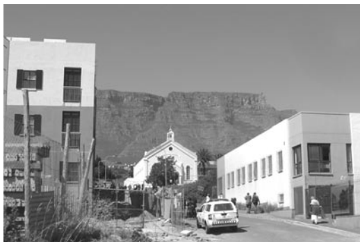
Kostel Moravian Hill v proslulém Distriktu 6.