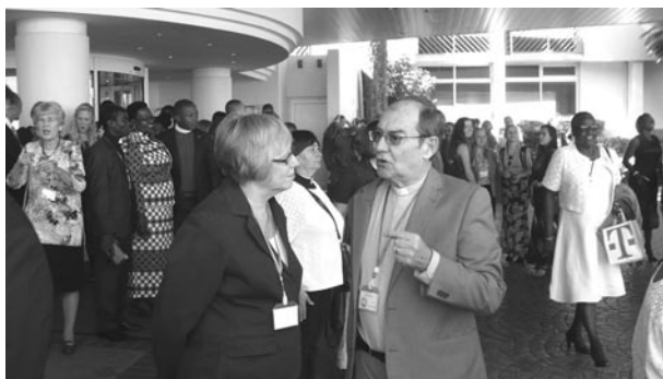
účastníci konference o přestávce jednání před hotelem

Celá konference probíhala radostně, zaujatě a dá se říci v duchu jednoty, pro některé účastníky to bylo milým překvapením, protože loňský světový synod byl zřejmě obtížnějším jednáním. Čemuž by se člověk neměl divit, když jde o správu církve,