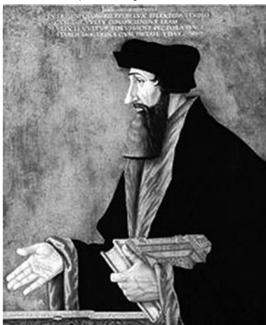
Johannes Oekolampad (1482 - 1531)

Tady už nějaký čas nebyl přítel Wolfgang Capito, který našel trvalý domov ve Štrasburku, kde pomáhal šířit reformaci. A mezitím tu byl zpátky i Erasmus, který se 1521 raději stáhl z konfliktní půdy německé do svobodného městského státu Basileje. Oekolampad, který si při minulém pobytu v Basileji stihl udělat doktorát teologie, využil svého práva přednášet jako doktor na univerzitě a začal tu učit Starý zákon. Protože se stal velmi uznávaným a oblíbeným, byl brzy jmenován profesorem.