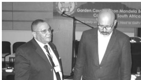
Bratr a metodista.