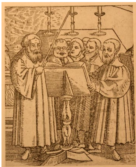
Výřez z titulního listu Šamotulského kancionálu, Jan Augusta vlevo

Zajímavé zjištění předkládá autorka knihy jako exkurz. Jde o Augustovy portréty. Nejznámější a nejužívanější portrét Jana Augusty pochází ze druhé poloviny 18. století (je použit např. ve staré publikaci Jednota bratrská v obrazech), tedy zhruba dvě století po Augustově smrti. Předpokládalo se, že podobizna bude spíš ideálním portrétem, který nemusí mít s Augustovou podobou nic společného. Na titulním listě Rohova kancionálu, kde je zobrazeno zpívající shromáždění, však stojí dva lidé v kněžském rouchu s ukazovátkem (rafíjí) v ruce. Jeden vlevo, zřejmě Jan Roh, druhý vpravo, a ten se nápadně podobá pozdějšímu portrétu Jana Augusty (vidět je dobře jen hlava, tělo je zakryto zpěvákem s tváří Jana Husa). Ještě zřetelnější je to později na titulním listě Šamotulského kancionálu, kde stejná postava, zjevně Augusta, stojí vlevo, vedle něj Blahoslav s brýlemi a patrně další tehdejší biskupové.