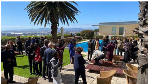
přestávka v jednání s výhledem na Kapské Město

Ruvuma je na jihovýchodě Tanzánie, při jezeře Nyasa u hranic s Malawi a Mosambikem. Je rozlehlá skoro jako naše republika, ale obyvatel má jako Praha. Centrem je město Songea. Misijní provincie Njombe je menší, asi jako třetina naší republiky a lidí pod milion (Njombe je zároveň jejím hlavním městem). Leží na sever