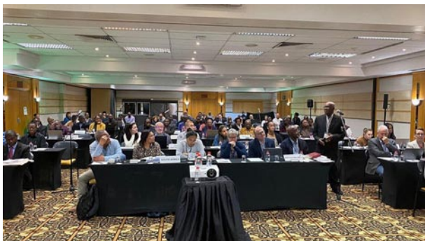
plenární zasedání synodu

od Ruvumy a ještě o něco na severovýchod je Iringa se stejnojmenným hlavním městem, rozlohou jako polovina Čech s méně než milionem obyvatel. Můžeme říci, že jde o oblast jihovýchodní Tanzánie.